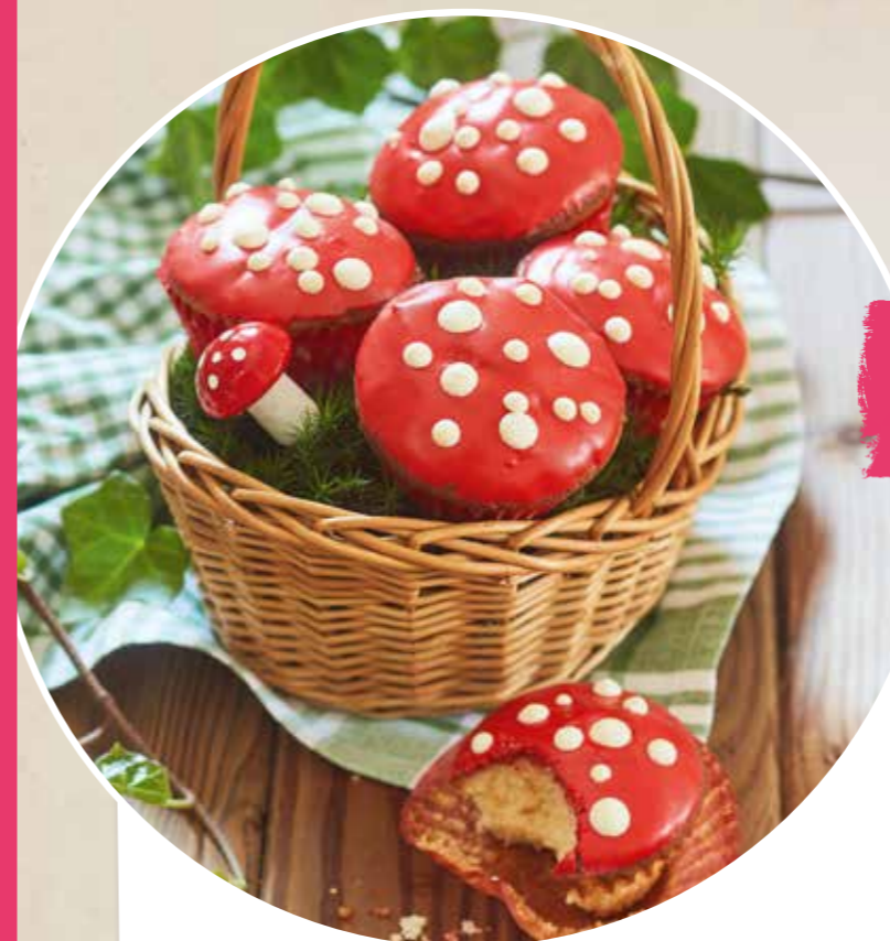
Knallpilz-Muffins aus dem Räuberwald