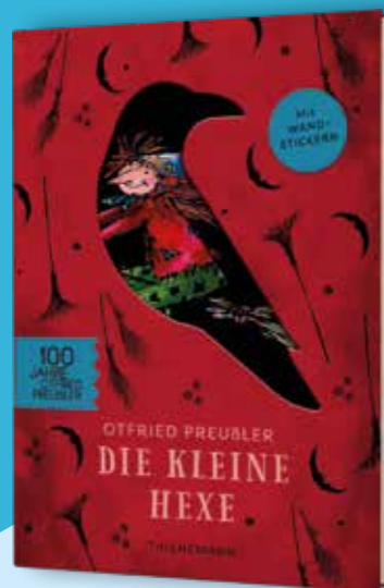
Die kleine Hexe ISBN 978-3-522-18642-1 · 18,00 €